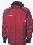
80-060-3062 true red/castle rock