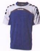
07-784-7691 true blue/white