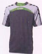
07-784-2652 castle rock/white