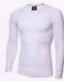
07-263-9389 white/dark grey