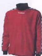
30-685-3081 true red/black