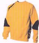
38-273-5115 sports yellow/black