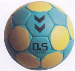
91-014-5159 neon yellow/carmine dark green