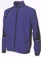
38-272-7079 true blue/black