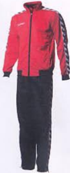
50-092-3081 true red/black