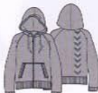
38-629-2006 grey melange