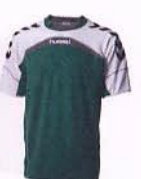
07-784-6131 eco green/black