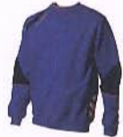
38-273-7079 true blue/black