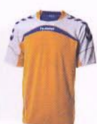
07-784-5168 sports yellow/black