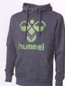
38-472-2600 dark grey