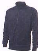
38-208-7429 blue navy