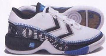
60-243-9560 white/black/chrome/olive blue