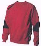
38-273-3081 true red/black