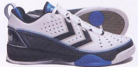
60-151-9560 white/black/chrome/olive blue

Außensohle: CM EVA-Zwischensohle mit EVA Komforteinlagen an der Stoßzone. Flexible Gummi-Außensohle.