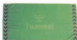
25-065-6331 jambone green/castle rock