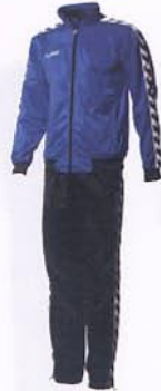
50-092-7079 true blue/black