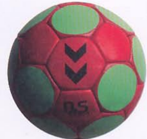
91-015-5159 ecru/light green