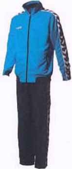
51-278-7465 dual blue/black