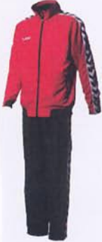
51-278-3081 true red/black