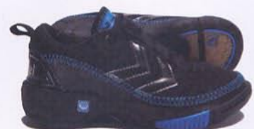
60-244-2171 black/olive blue