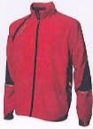
38-272-3081 true red/black