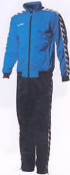
50-092-7465 diva blue/black