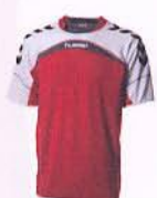
07-784-3946 true red/white