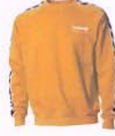
30-646-5001 solar yellow