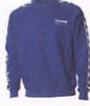
30-646-7045 blue blue