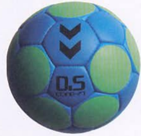
91-013-7754 neon blue/mesh green