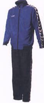
51-278-7079 true blue/black