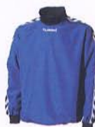
30-685-7079 true blue/black