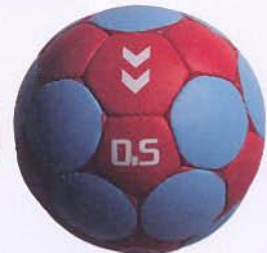
91-016-7444 light blue/red