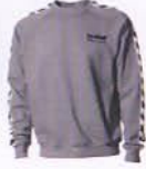
30-646-2529 new grey fade/gray