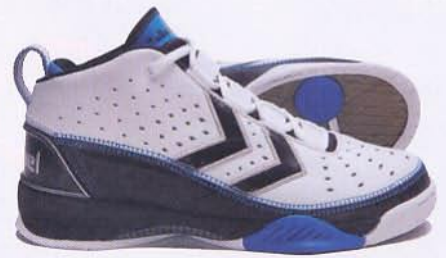
60-144-9560 white/black/chrome/olive blue

Außensohle: CM EVA-Zwischensohle mit EVA Komforteinlagen an der Stoßzone. Flexible Gummi-Außensohle.