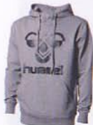
38-472-2006 grey melange