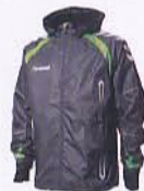
80-060-2600 castle rock/jasmine green