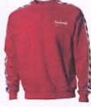
30-646-3062 crushed red